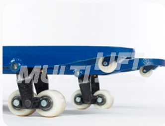
Ruedas de Nylamid tipo tándem.