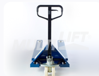
Maneral de operación con manija de 3 posiciones.