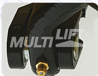
Graseras de lubricación en puntos clave.

Su mejor opción para manejar contenedores de medidas especiales con un largo de hasta 2.30 mts.