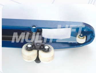
Rodillos de entrada y salida adicionales.