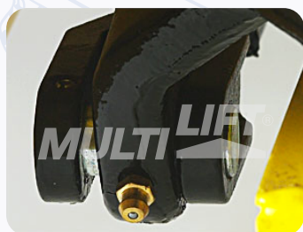
Graseras de lubricación en puntos clave.