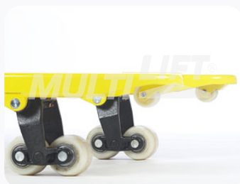
Ruedas de Nylamid tipo tándem.