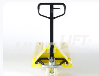
Maneral de operación con manija de 3 posiciones.