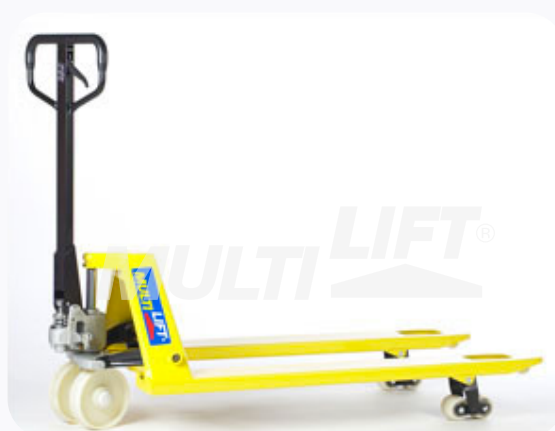
Estructura de Acero con ruedas delanteras y traseras de nylamid.