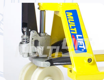
Bomba hidráulica de una sola pieza, que maximiza eficiencia y productividad.