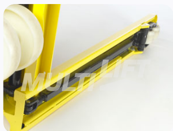
Construcción ultra reforzada.