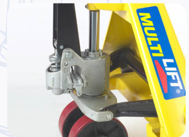
Bomba hidráulica de una sola pieza que maximiza eficiencia y productividad.