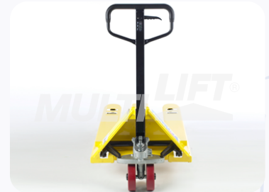
Maneral de operación con manija de 3 posiciones.