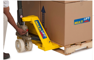
Exclusivo sistema para asegurar el perfecto funcionamiento a un ángulo de 90°.