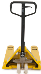
Maneral de operación con manija de 3 posiciones.