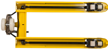
Construcción ultra reforzada.