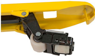
Gracias a su rueda auxiliar delantera, cuando el patín se levanta puede trabajar en un ángulo de 90°.