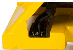
Graseras de lubricación en puntos clave.